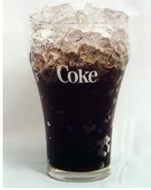
«a Coke» (колу)