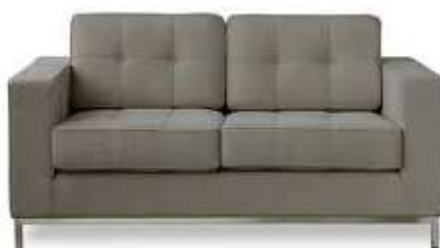
Loveseat Диван (на два места)