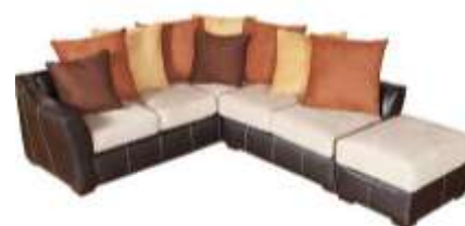
Sectional Секционный диван