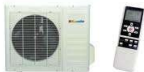
Air conditioner Кондиционер