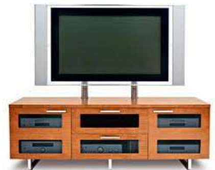
TV stand Тумбочка под телевизор