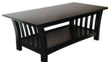
Coffee table Журнальный столик