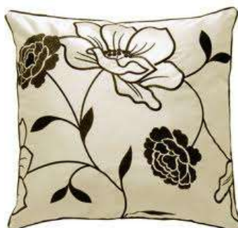
Cushion Декоративная подушка