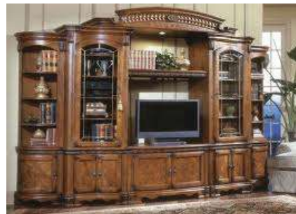
Entertainment center Стенка