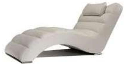
Chaise longue Шезлонг