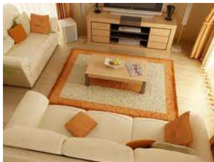
Living room Гостинная