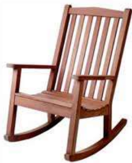
Rocking chair Кресло-качалка