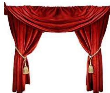
Curtain (BE), Drape (AmE) Штора