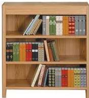
Bookcase Книжный шкаф