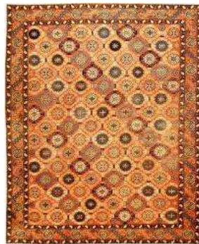
Carpet, rug Ковер