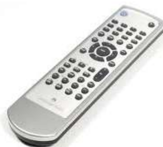
Remote control Дистанционный пульт